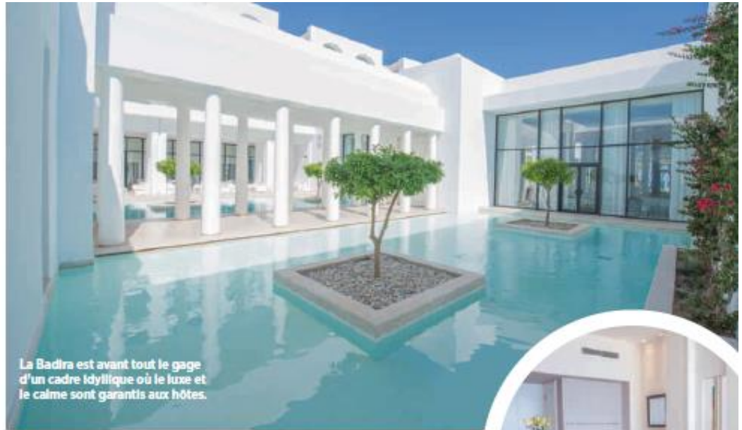
La Badira est avant tout le gage d'un cadre idyllique où le luxe et le calme sont garantis aux hôtes.

privées. Pour rendre hommage aux artistes qui fréquentaient Hammamet, Mouna Ben Halima leur a dédié les suites spectaculaires qui embrassent le front de mer, déclinant l'univers de chacun dans la décoration des lieux. Ainsi, on découvre la suite Jean Cocteau, décorée de coussins sérigraphiés et de citations de l'auteur, la suite bleu et blanche